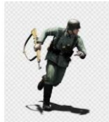
De Infantaria, Soldado, S... gratispng.com