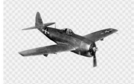
República P47 Thunderbolt, De Avião, Segund... gratispng.com