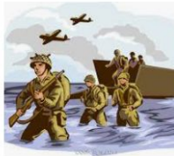
Dia D da Segunda Guerra Mundial ... pt.coolclips.com