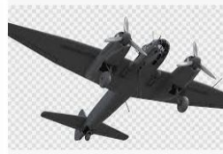
Aviões de caça da segunda guerra mundial...