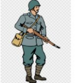
Segunda Guerra Mundi... gratispng.com