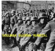
Segunda Guerra Mundial slideshare.net