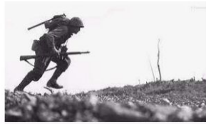
Solenidade lembra os 70 anos da vitória aliada na... radiocaxias.com.br