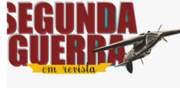
Exposição 2º Guerra Mundial arquivoestado.sp.gov.br