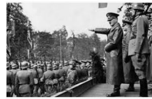
1 de setembro de 1939 – Alemanha invade ... causaoperaria.org.br