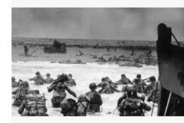
Dez livros que contam histórias da Segund... intrinseca.com.br