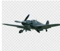
De Avião, Segunda Guerra Mundial...