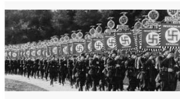
4 armas assustadoras usadas pelos nazistas durante ... tecmundo.com.br