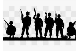
Primeira Guerra Mundial, Guerra Mundial, Se...