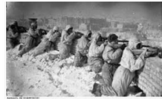
Segunda Guerra Mundial: resumo e fases do co... todamateria.com.br