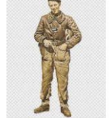
Guerra mundial Z png | ... pngwing.com