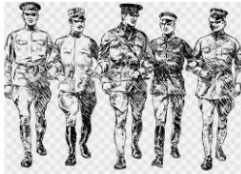
Primeira Guerra Mundial, Segunda Guerra... gratispng.com