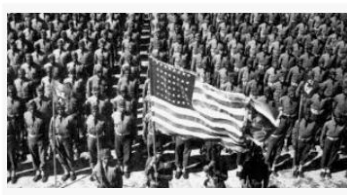
Segunda Guerra Mundial: como impactou a história? - ... politize.com.br