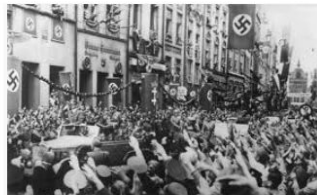
Invasão da Polônia e o início da Segunda Guerra... historiadomundo.com.br