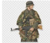
Soldado, Segunda Guerra Mundial...