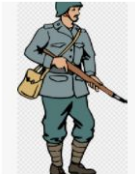
Segunda Guerra Mundi... gratispng.com