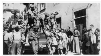
Confira países latino-americanos que participaram d... br.sputniknews.com