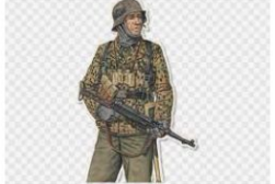
Segunda Guerra Mundial, Soldado, Livro p... gratispng.com