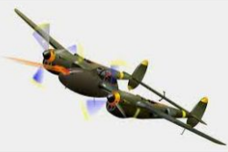
Avion Segunda Guerra Mundial Png, Transparen... pngitem.com