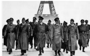
Segunda Guerra Mundial: resumo e fases do c... todamateria.com.br