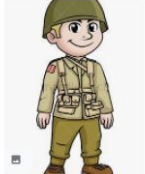
WW2 American Soldier...