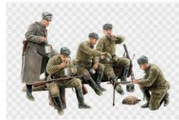
Segunda Guerra Mundial, 135 Escala, Soldad... gratispng.com