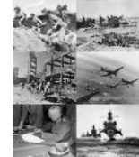
Segunda Guerra Mundi...