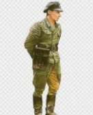
Uniforme Militar, Solda... gratispng.com