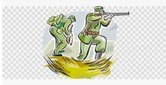
Primeira Guerra Mundial Segunda Guerra Mundial Soldado ...