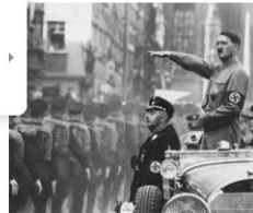
5 ideias incorretas sobre a Segun... hypescience.com