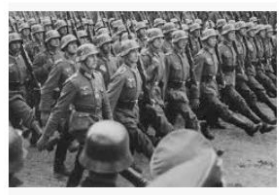
Vídeo Resumo da Segunda Guerra Mun... segundaguerra.net