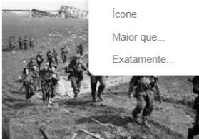
Segunda Guerra Mundial