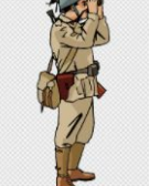
Segunda Guerra Mundi... pngwing.com