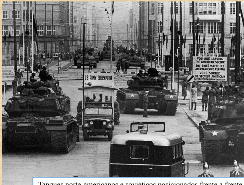
Tanques norte-americanos e soviéticos posicionados frente a frente nas ruas de Berlim. Outubro de 1961.