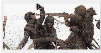
Conheça a Coletânea em Quadrinhos Arquivos Secretos... torrevigilancia.com